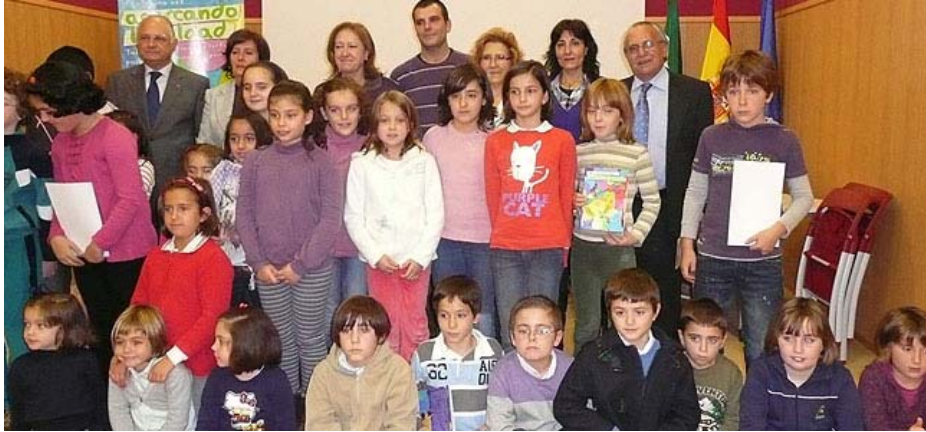
Escolares que asistieron a la presentación del libro.

El libro titulado 'Érase una vez..., acercando igualdad' recoge los trabajos realizados por más de un centenar de alumnos de Primaria de 19 centros educativos cacereño durante septiembre y octubre en talleres de fomento de la lectura y de la creatividad. La obra, presentada en la tarde de ayer, está ilustrada y completada con finales alternativos por los escolares.